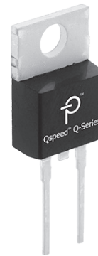
封装: TO-220AC, D2PAK, DPAK, TO-247AD, TO-220AB

注释: I_{F(AVG)} : T_J = 150^\circ\text{C} ; V_F : T_J = 150^\circ\text{C} ; Q_{RR} : T_J = 25^\circ\text{C} ; 600 V TO-220AC = 隔离